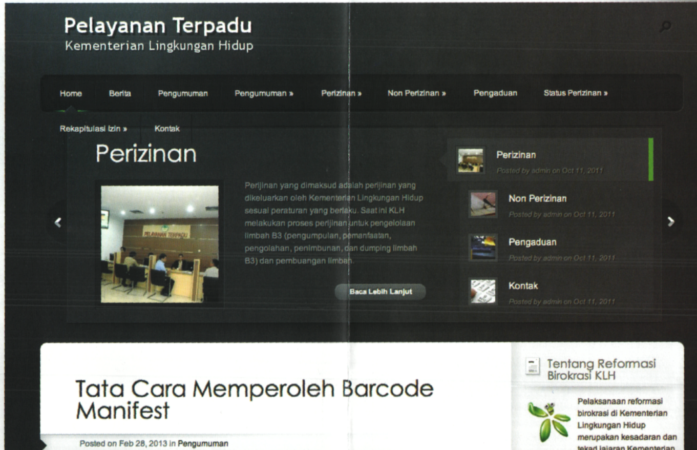
Gambar 3, Website Unit Pelayanan Terpadu - KLH Prima